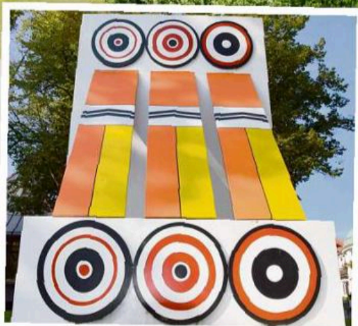
Auch die Plastik von Peter Brüning auf der Rottweiler Skulpturenmeile ist Teil des Programms.

→ Alle Filme sind abrufbar unter https://regio-kunstwege.eu sowie YouTube-Kanal REGIOKunstwege.